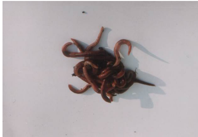
Рис. 3. Вигляд біомаси дощових черв'яків.

Графічну залежність необхідної початкової маси дощових черв'яків до планової маси річної переробки субстрату показано на рисунку 4.