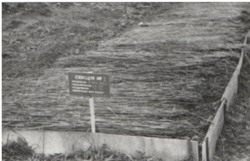
Рис 2. Вигляд поверхні бурта з вермикюльтивуваним субстратом.