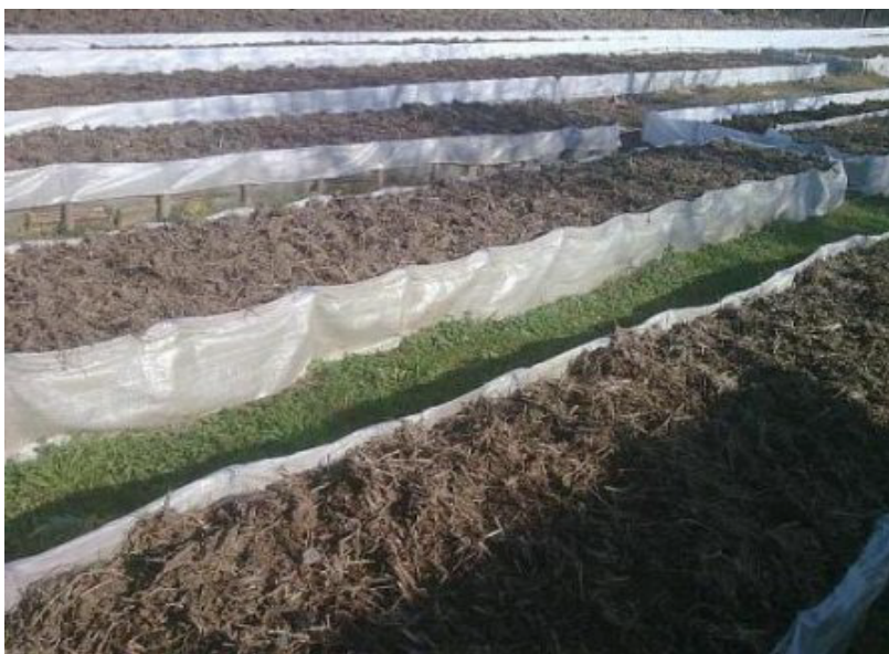
Рис. 1. Вид вермигосподарства відкритого типу.