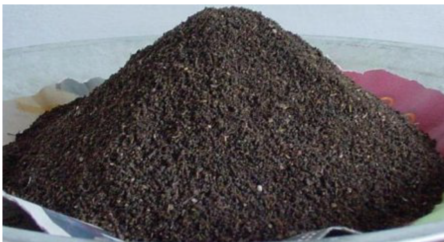
Рис. 5. Біогумус-сирець.

Якщо переробляти подрібнені гілки, то повне вибирання можна проводити через 1,5 роки.