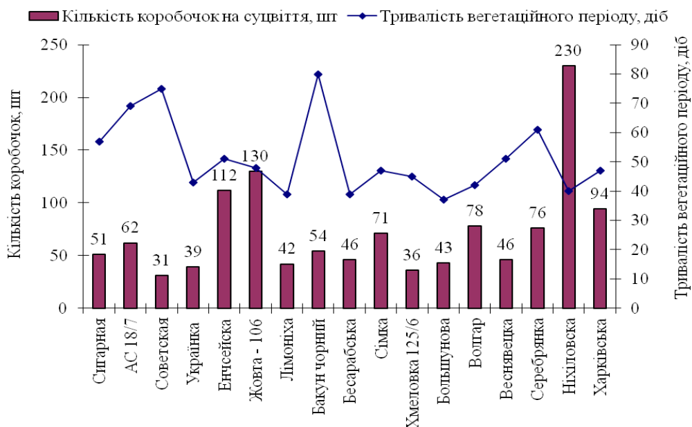
Рис. 3. Залежність урожайності сортів махорки від тривалості періоду вегетації (2011-2015 рр.).

Серед великої кількості показників, що характеризують сорт, провідне місце належить продуктивності, яка є складовою інших ознак, що є визначальними і повною мірою дозволяють розкрити потенціал сорту та перспективу його використання в селекції. Дослідження показали, що найбільша кількість коробочок сформувалася на високорослих рослинах, як наприклад 230 коробочок дав сорт Ніхільовська з висотою стебла 80 см, тоді як сорти з середнім та низьким стеблом – АС 18/7 (35 см) сформували лише 62 коробочки та сорт Серебрянка (61 см) сформував 76 коробочок.