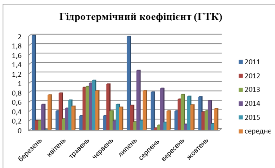
Рис. 1. Господарська оцінка клімату низинної зони Закарпаття за 2011-2015 рр.

Аналізуючи гідротермічний режим низинної зони Закарпаття необхідно зазначити, що погодні умови 2011-2015 років характеризувались сильно посушливими періодами та періодами нестійкого зволоження (рис. 1), що значно впливає на проходження фаз росту і розвитку махорки.