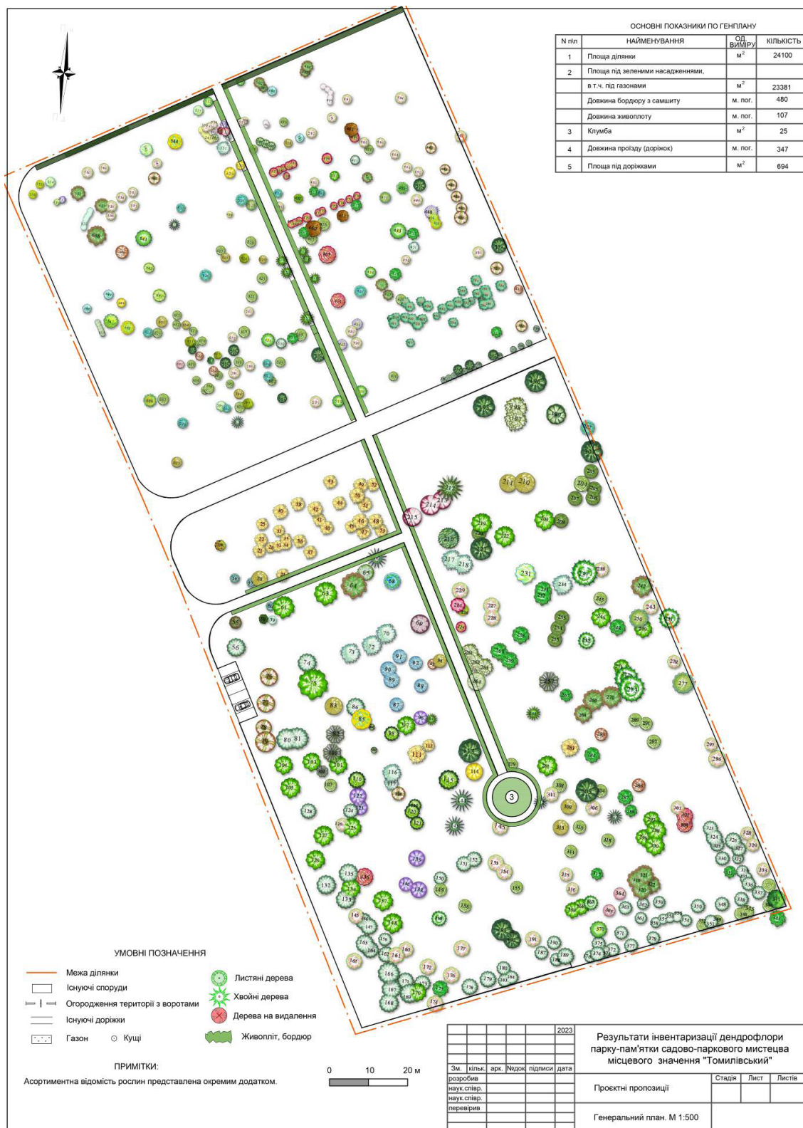
Рис. 2. Генеральний план.