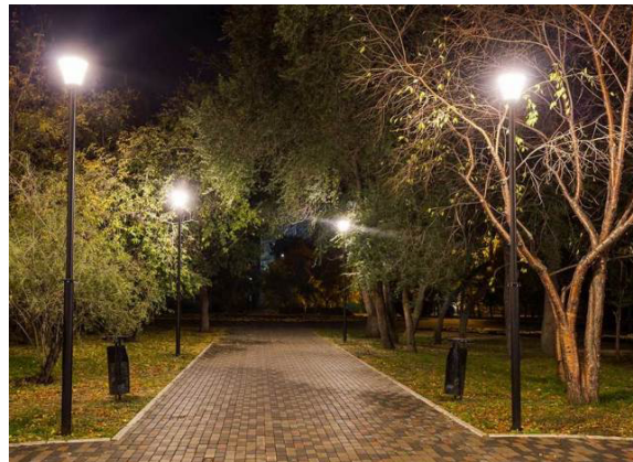
Рис. 6. Комп'ютерна модель вигляду доріжки парку після реконструкції у вечірній час.