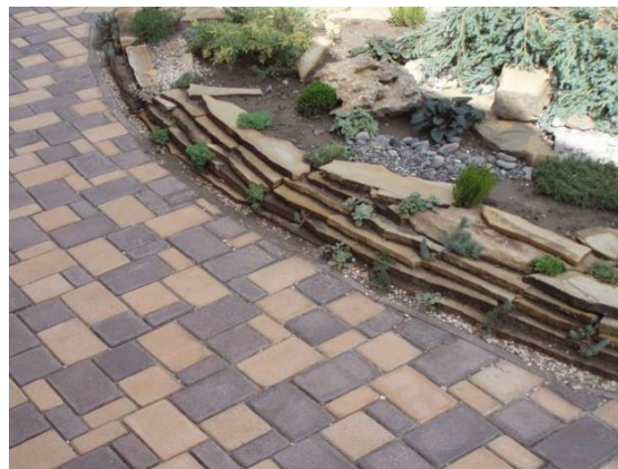
Рис. 7. Приклад мощення садових доріжок у парку та обмеження периметру клумби плитками пісковика.