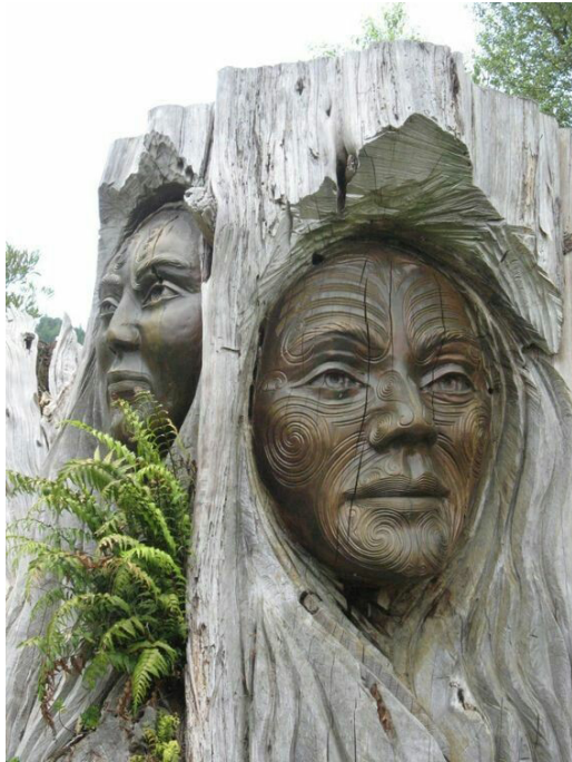
Рис. 3. Приклад скульптури на стовбурі сухостійного дерева.