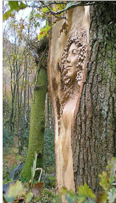
Рис. 4. Приклад скульптурного зображення на стовбурі дерева.