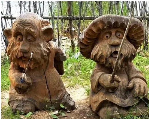
Рис. 5. Дерев'яні скульптури як приклад для використання.