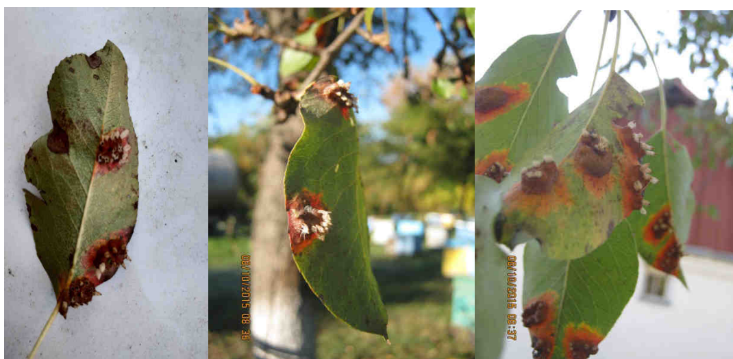
Рис. 2. Ураження листкової пластинки групами ецій збудників роду Gymnosporangium у вигляді конусо- або соскоподібних виростів.

Восени ецидіоспори, потрапивши на рослини видів з роду Juniperus L., за наявності вологи проростають, утворюючи грибницю, яка поширюється в корі і деревині. Під дією грибниці відбувається посилений ріст клітин, унаслідок чого гілка ялівцю в пошкодженому місці потовщується (рис. 2). Через 1,5–2,5 роки з моменту зараження видів з роду Juniperus L., навесні (кінець березня–квітень) в місцях потовщення під корою з'являються телейтоспороношення гриба Gymnosporangium у вигляді коричнево-бурих виростів. За підвищеної вологості повітря та позитивних температур (не нижче + 5 °C) вирости