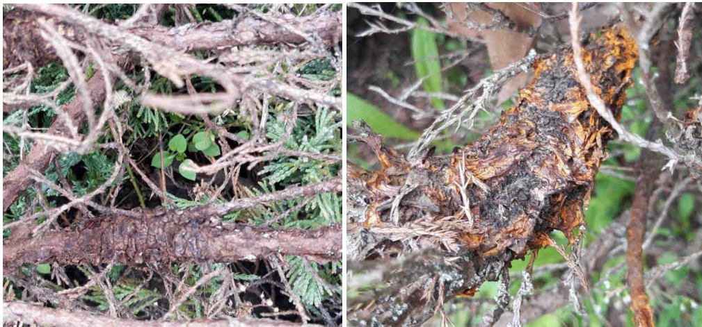
Рис. 3. Ураження ялівцю збудниками роду Gymnosporangium у вигляді потовщення гілок.