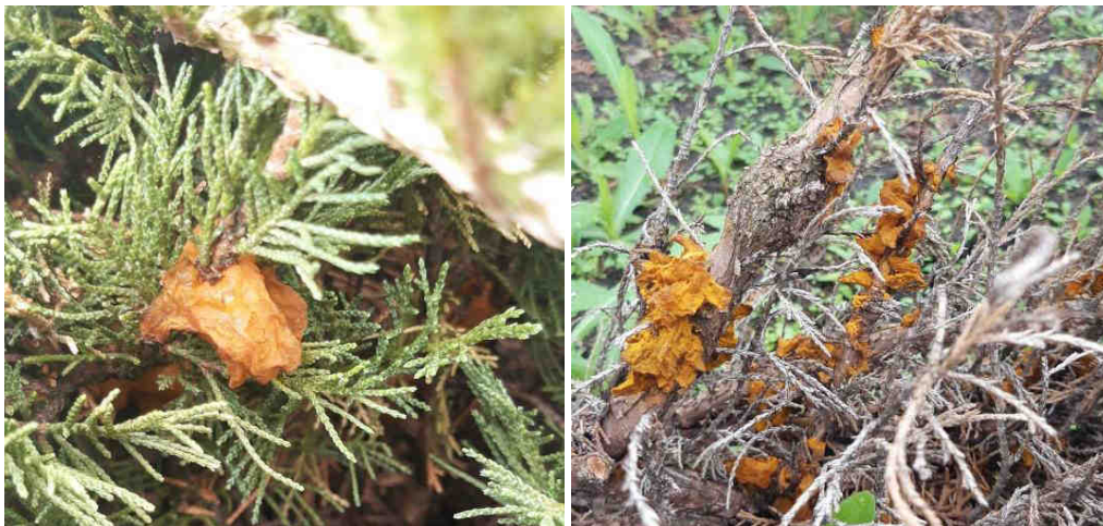
Рис. 4. Телейтоспороношення гриба Gymnosporangium у вигляді коричнево-бурих виростів на гілках ялівцю.

У результаті фітосанітарного моніторингу видів з роду Juniperus L. в садово-паркових об'єктах Київської області та колекційного фонду Ботанічного саду БНАУ встановлено, що патологічний комплекс збудників, які спричинюють розвиток іржі плодів зерняткових дерев різних видів, різниться за складом. Зокрема на Juniperus communis L. домінування мав гриб G. tremelloides Hartig. На Juniperus foetidissima виявлено три види збудника – G. sabinae Wint., G. dobrozrakovae Mitrof., G. confusum Plowr. На J. excels виявлено два види збудники G. sabinae Wint., G. dobrozrakovae Mitrof., на J. oxycedrus , J. phoenicea – по два збудника G. sabinae Wint., G. confusum Plowr., де значне домінування мав G. sabinae