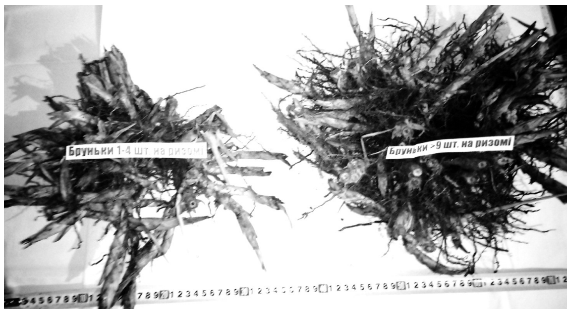
Рис.1. Маточні кореневища в кінці вегетації, які мали 9 і більше бруньок (праворуч) та 1-3 штуки (ліворуч), 2017 р.

Дослідженням факторів, які впливали на масу маточних кореневищ встановлено, що частка впливу фактора якості ризом – кількість бруньок в середньому за три роки була значною і становила 64,8 % (рис. 2).